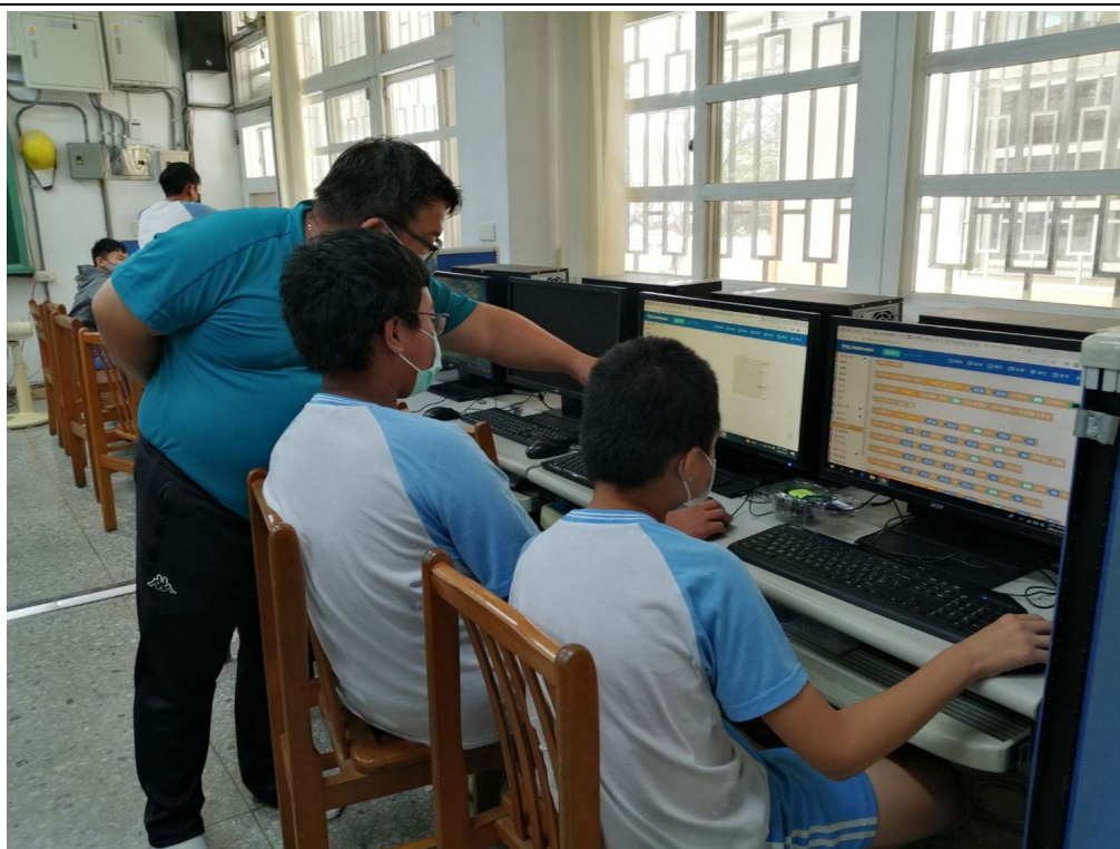
相片說明：教師解決學童問題