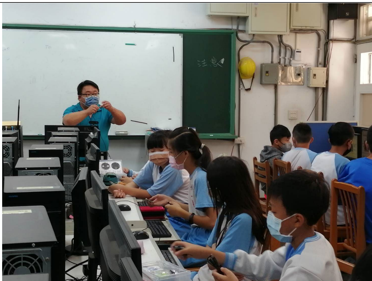
相片說明：教師介 webai 板