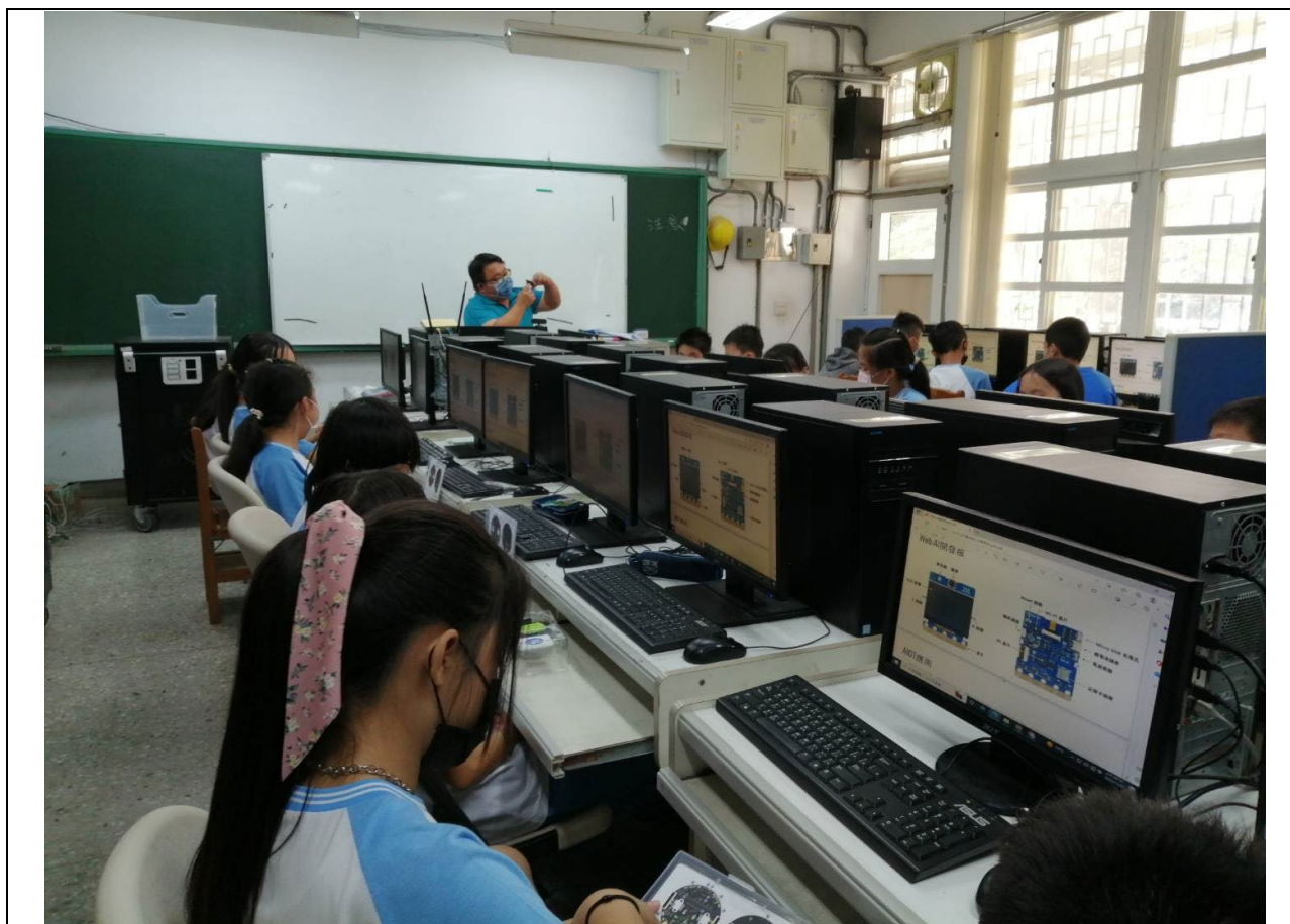
相片說明：學童對照 webbai 板上的相關位置