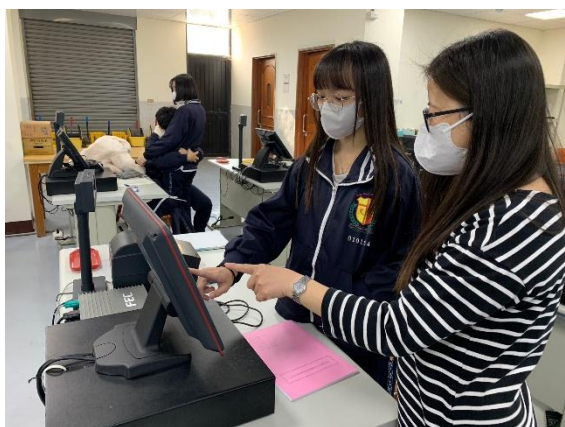
教學活動照片 (時間:111/12/06)