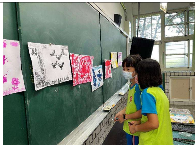
學生上台票選喜愛的作品