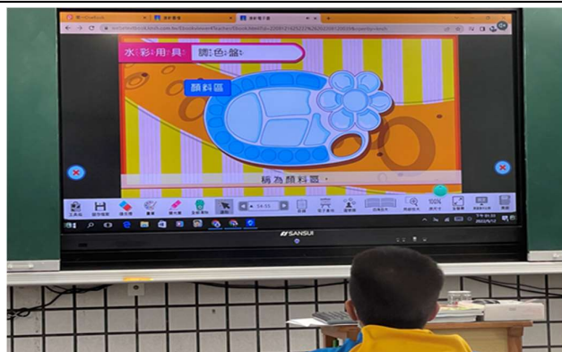
影片介紹：調色盤使用說明與示範