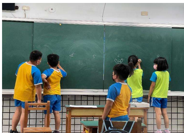
學生上台寫出想要畫的主題