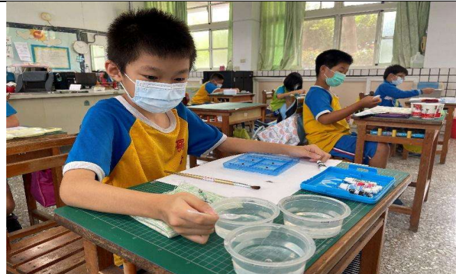
學生桌面用具擺放正確