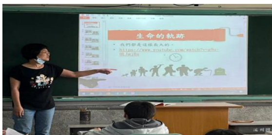
播放人的一生命影片