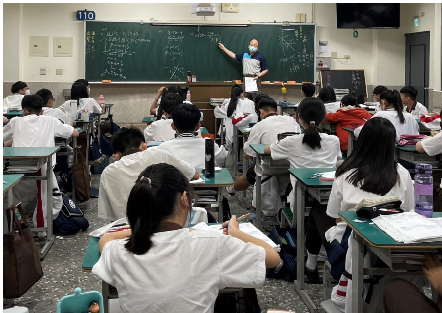
講解過兩點求出一元二次方程式

上課時須隨時注意學生的反應狀況，觀察其表情，要求學生認真學習，因常常一晃眼，學生會呈現發呆，使教學、學習效果都變差，另外可以在同學快睡著時，帶一點比較有趣的話題引起注意，提高學習力，有時叫同學回答或更多互動，讓同學學習更投入、專心。另外，須注意常常未成功課的同學，給予適當的要求或鼓勵(但不能佔用太多時間)。