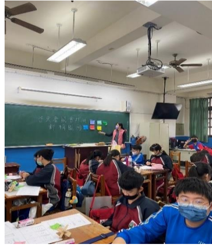
說明：解說與示範遊戲規則