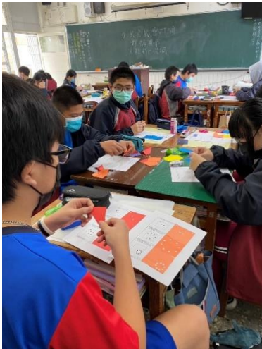
說明：解說與示範遊戲規則