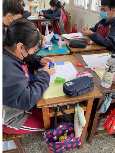
巡視各組遊戲情形並解答疑惑