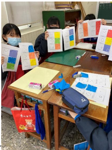
說明：討論與填寫學習單