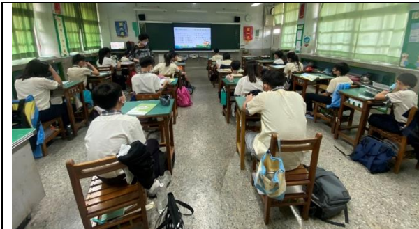
學生念課文，老師邊巡視邊聽個別學生念誦。