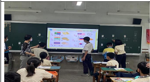
除了課本提到的特產，請學生上台書寫其他的特產，如德國有豬蹄，還有啤酒等。