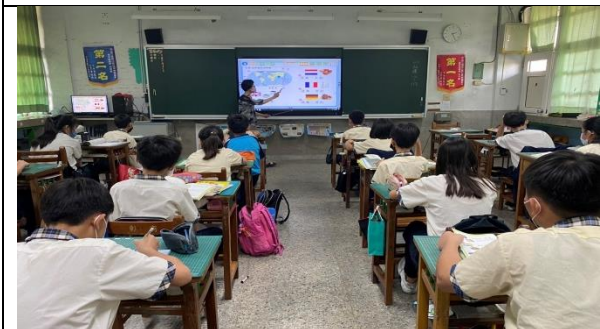
詞語教學：大家一起讀誦各國國名和特產