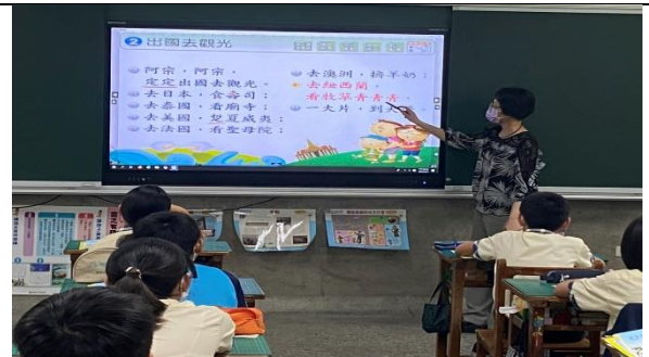
聽電子書的讀誦，針對容易讀錯的詞句再複習一次。