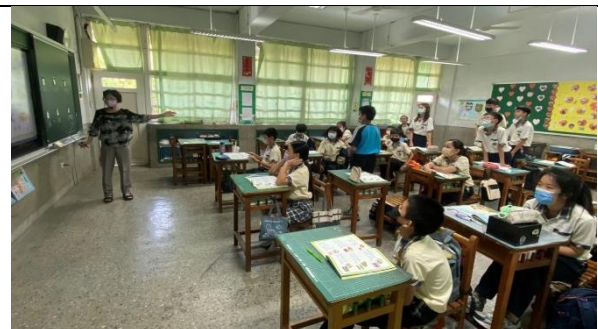
寫完後，請到黑板書寫的人用閩南語讀看看，讓全班也學習其他的語詞。