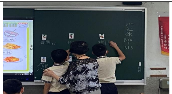
詞語教學評量：黑板上貼上詞語卡，抽學生上台填寫國名。