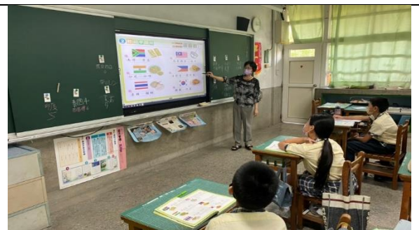
最後再複習全部語詞一次。