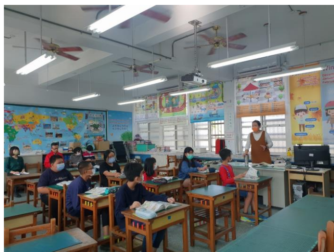
課堂特別表現事件紀錄