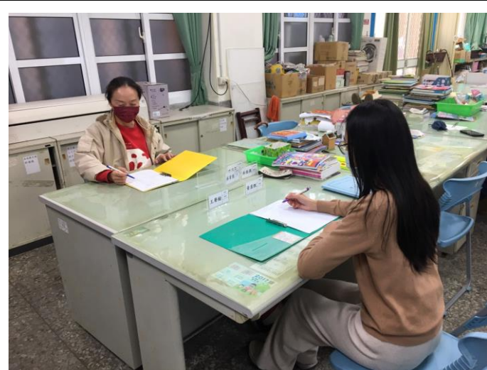
照片 6：觀課後回饋會談