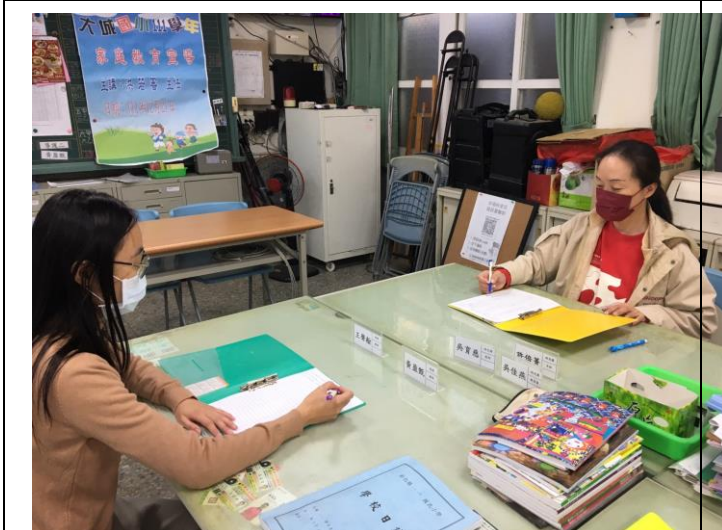
照片 5：觀課後回饋會談