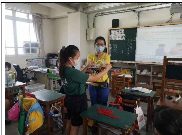
公開授課照片 3：老師課堂巡視