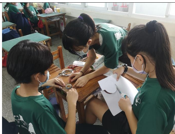
公開授課照片 4：最後總結說明