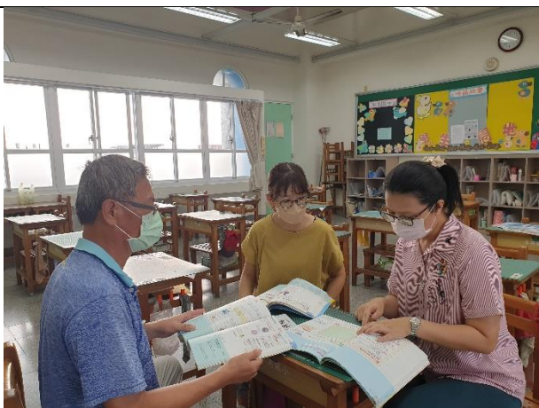
備課照片 1：(文字說明)