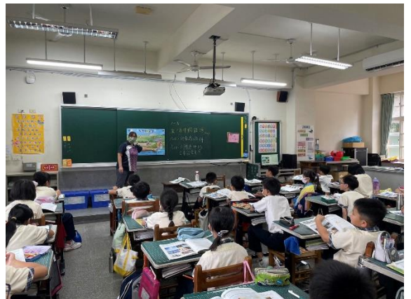
說明：海報主題講解