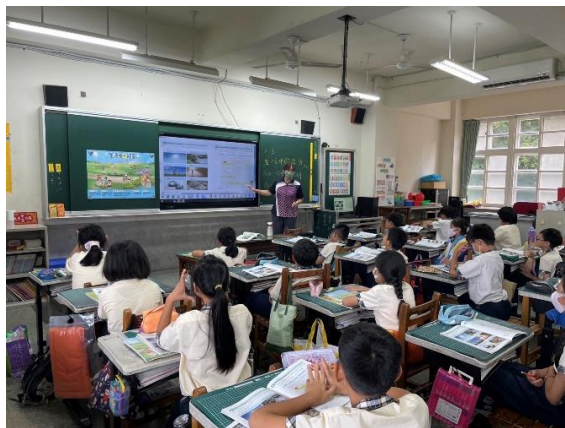
說明：老師講解習作習題