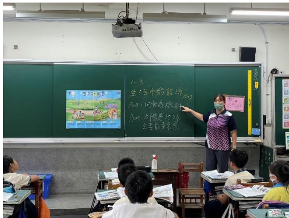
說明：老師講解主題觀念