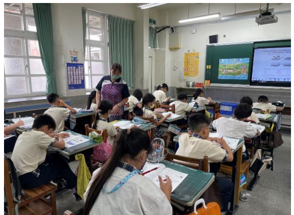
說明：老師講解學習習題