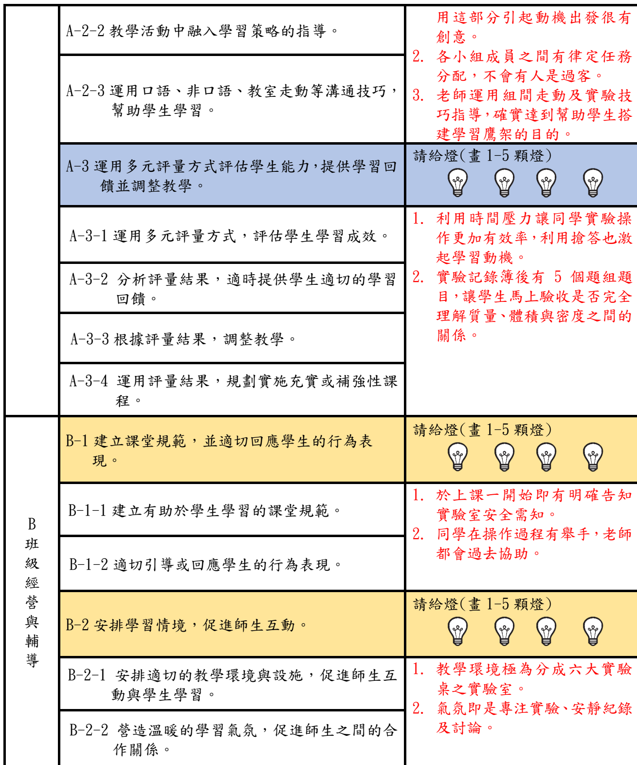
表 3、議課會談回饋表(會後請交回工作人員)