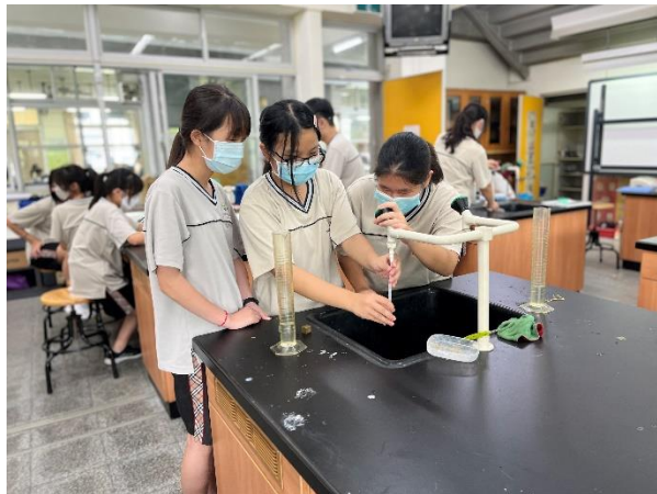
上課實際照片(班級：八乙/日期：20220912)