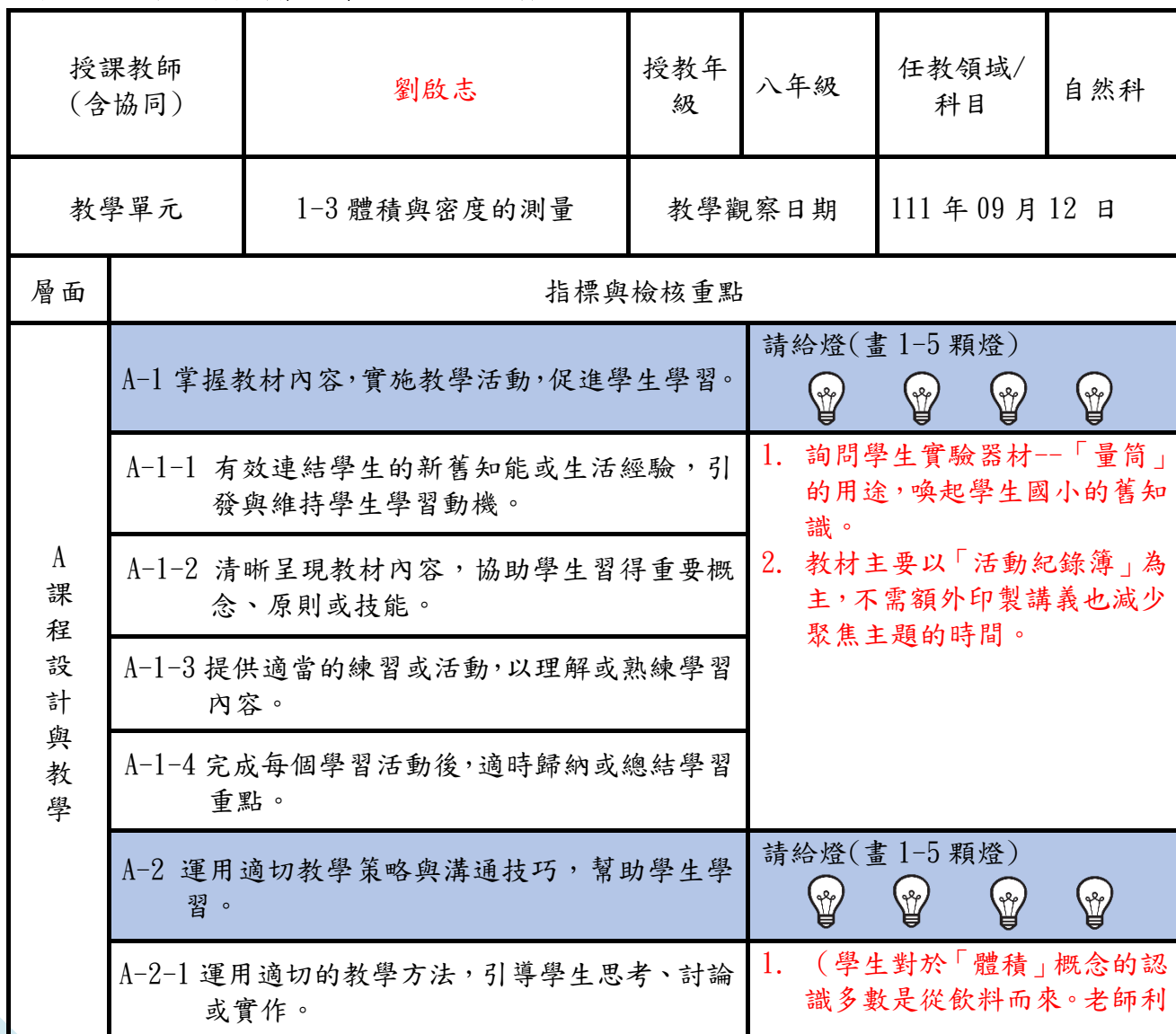
表 2、觀課紀錄表(會後請交回工作人員)