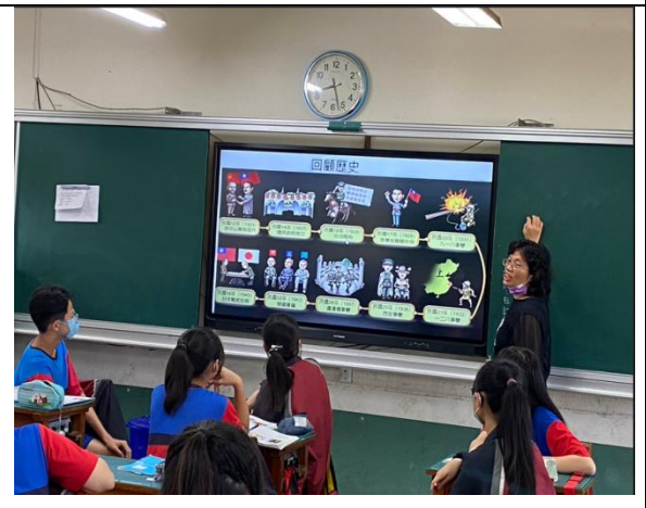
老師用 PPT 上課，解釋國共關係圖