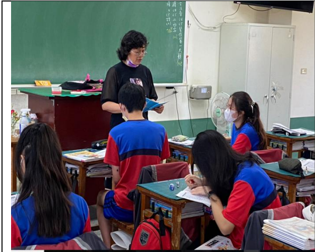
老師上課前小考和對答