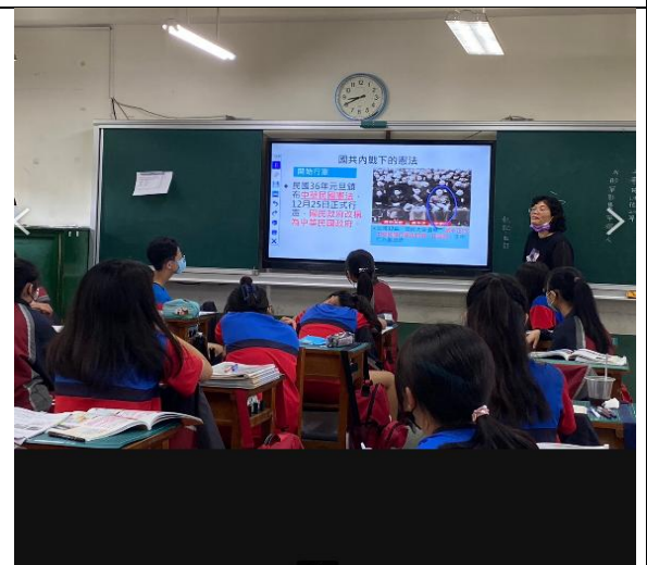
老師用 PPT 上課，解釋國共內戰