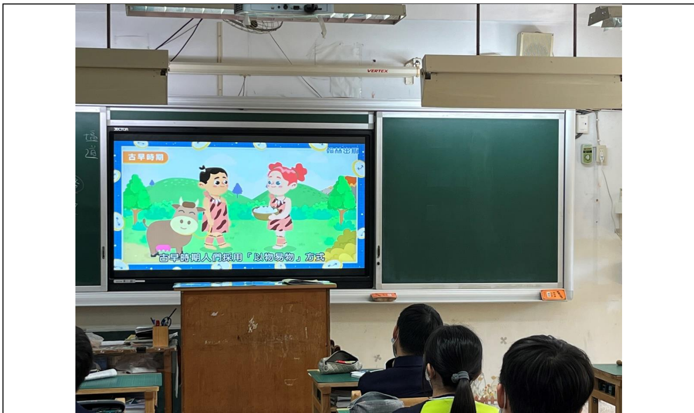
照片1說明：學生觀看貨幣相關影片