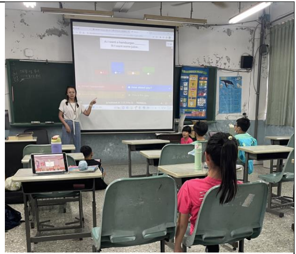
全班一起檢討錯誤題目