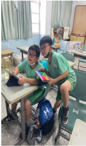
同組的學生可以先討論再作答