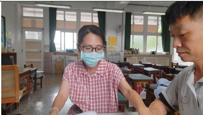
議課照片 1：(文字說明)