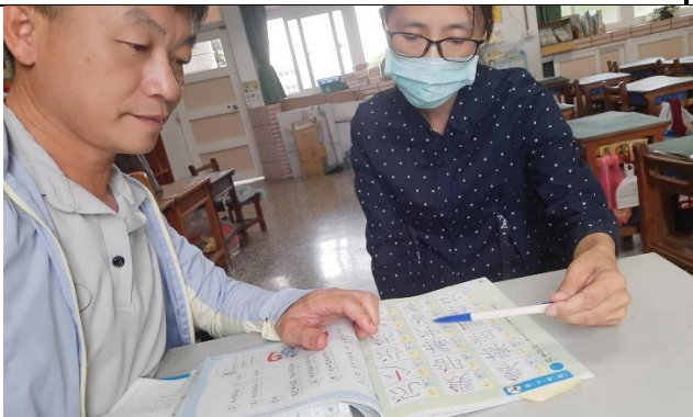
備課照片 1：（文字說明）