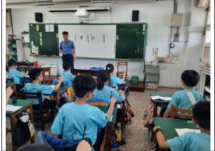
公開授課照片 3： 推派代表上台發表