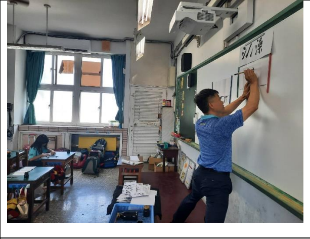
公開授課照片 2： 四步驟解說