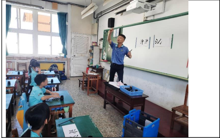
公開授課照片 1： 四格漫畫