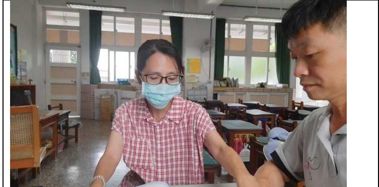
議課照片 1： 課後討論