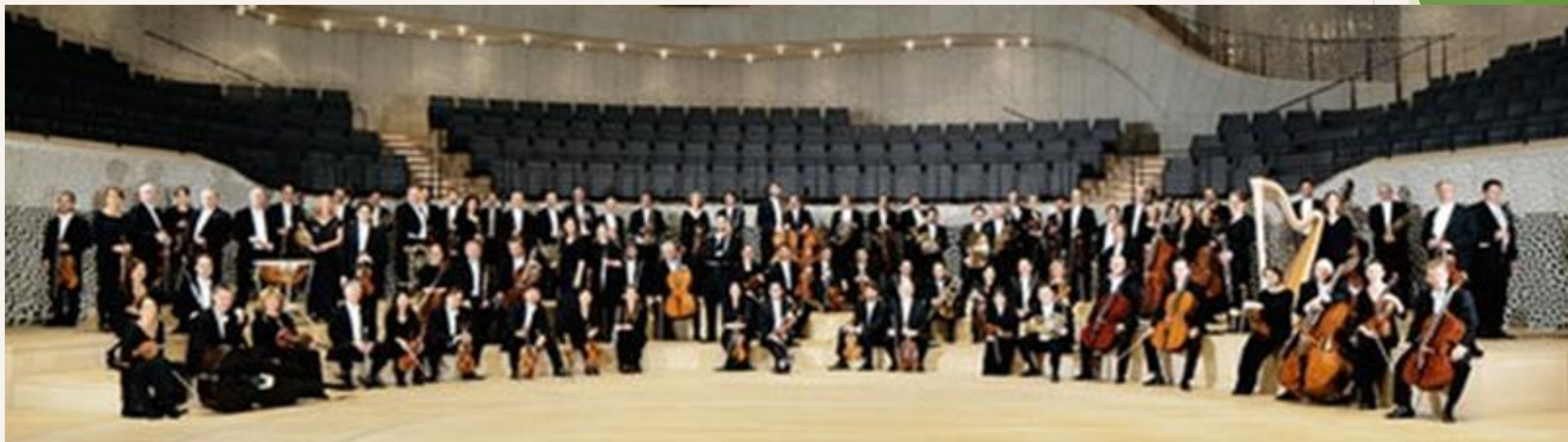
北德廣播易北愛樂樂團(NDR Sinfonieorchester) 位於德國漢堡