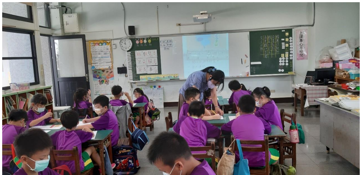
圖二、老師行間巡視檢視學生學習成效。