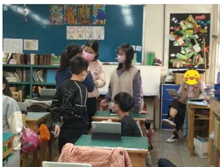
小組討論，練習「我訊息」句型