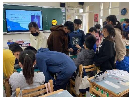
小組討論，如何合宜表達