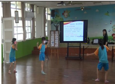
教師將重點貼在白板