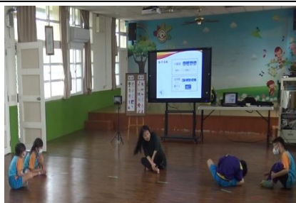
教師進行組別指導