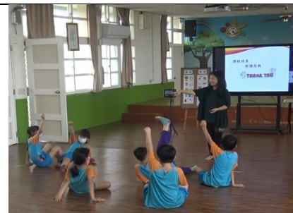
教師提問學生回答