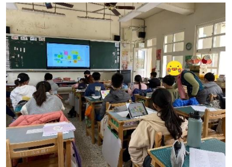
老師協助操作不熟的學生