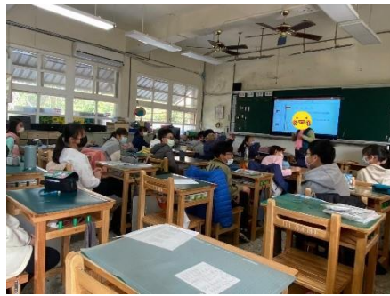
介紹本次課程的學習目標