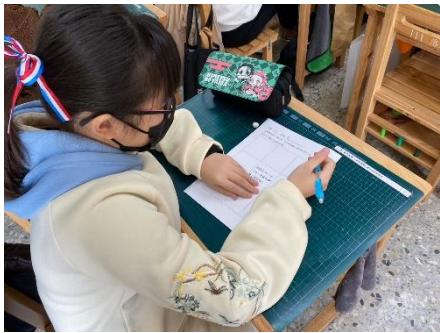
寫學習單思考追求這件事