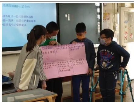
愛情需要編劇！說愛情故事