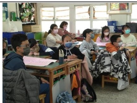
學生專注聆聽每一個故事