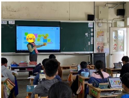
用電子白板匿名分享