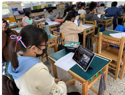
混成教學，學習不中斷