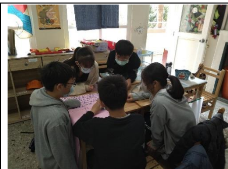
愛情需要編劇：小組討論