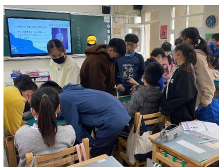
小組討論，如何合宜表達