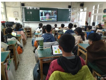
閱讀影片-為什麼需要跟騷法？