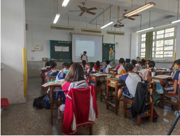
(說明) 學生上台發表分組討論結果