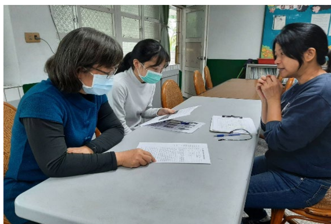
觀課老師意見分享