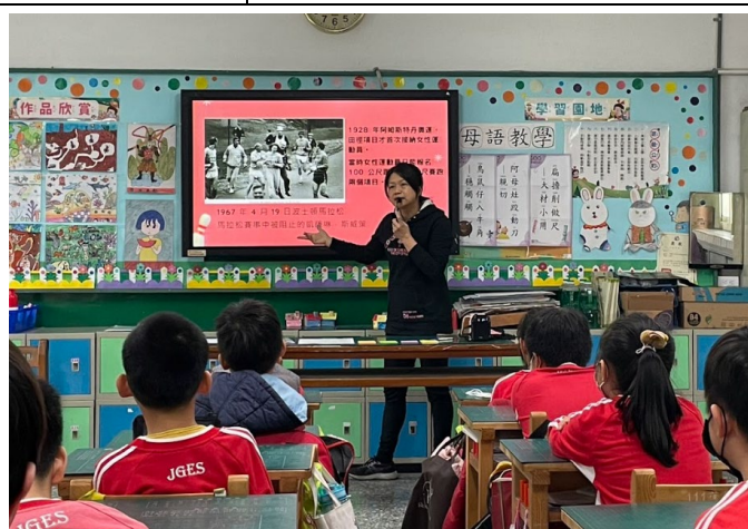
以照片故事述說女性在馬拉松賽事上的努力

課程最後詢問學生對升上五年級時要上游泳課的態度，學生的反應也很熱烈，希望能在升上五年級的暑假前，就請家長帶著自己去選購適合的泳裝。期望能透過本次課程，真正提升學生對未來參與游泳課程的意願，讓女學生與男學生一樣熱情的投入運動，享受運動的樂趣。