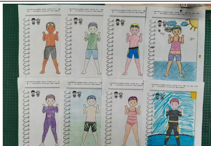
學生學習單作品—泳裝設計