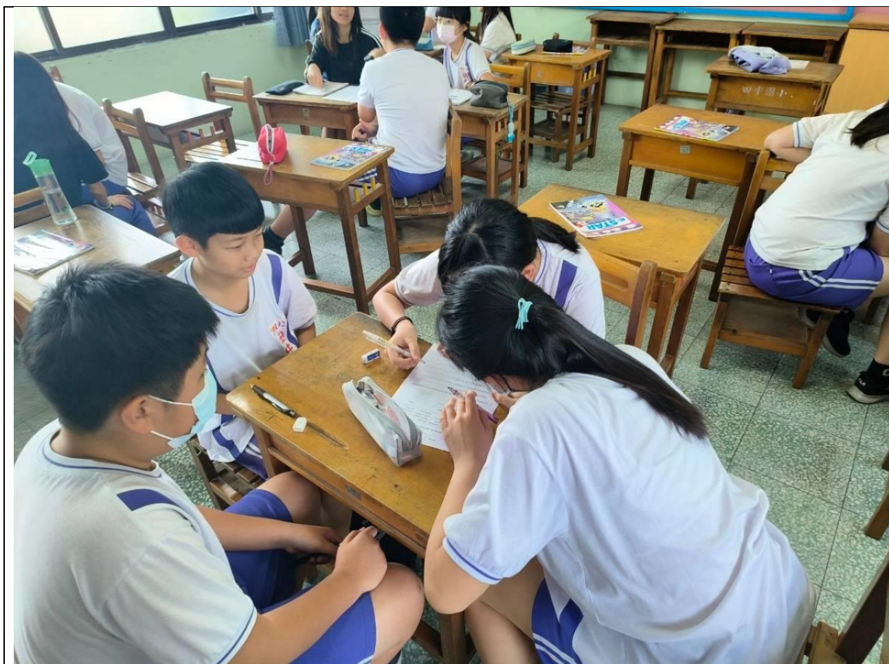
文字說明3: 差異化學習單