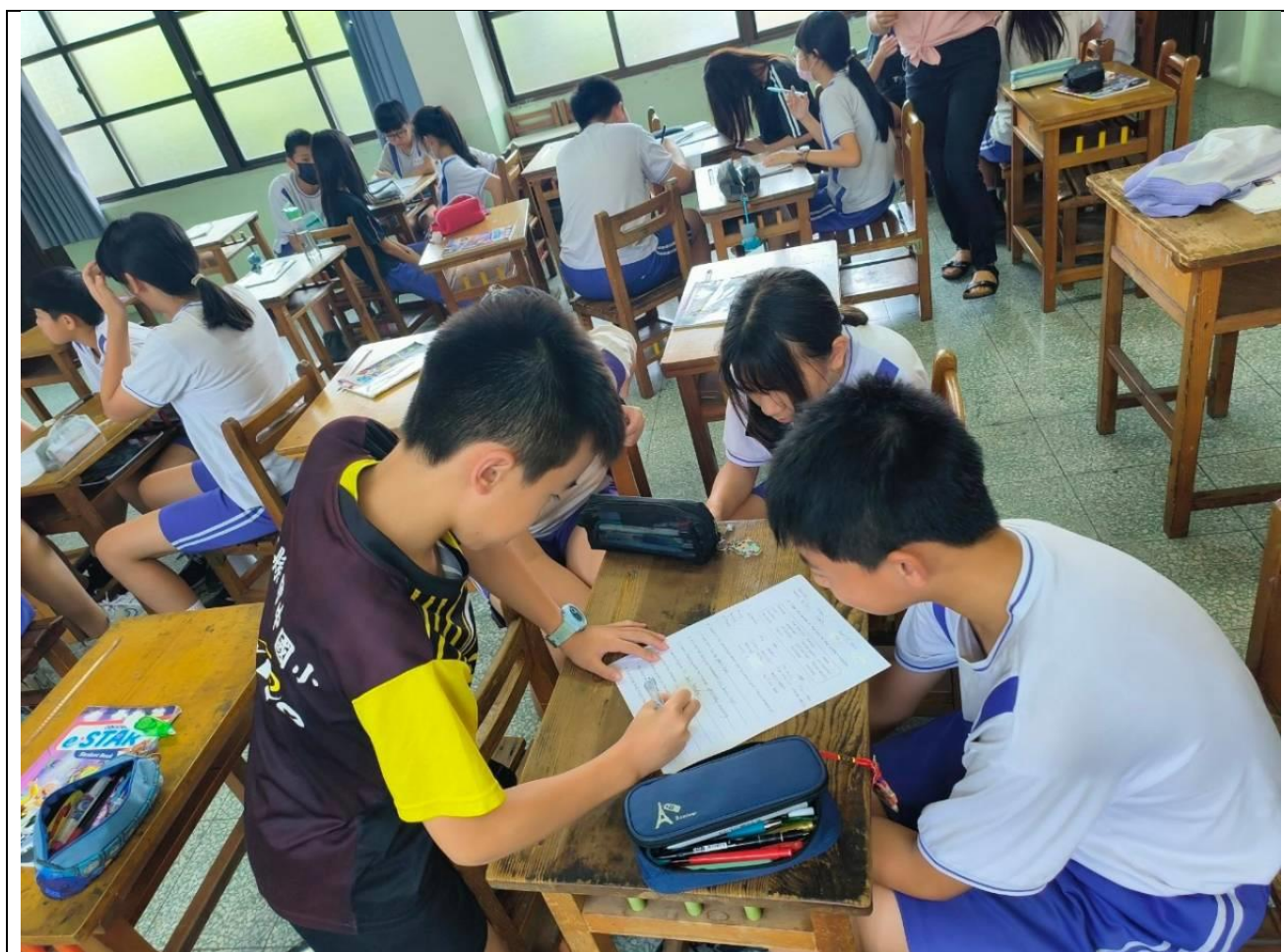
文字說明1:學習單檢核