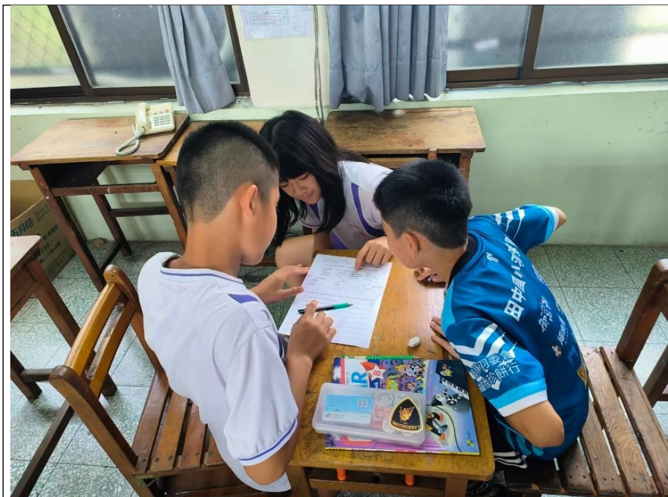
文字說明2：任務取向檢核