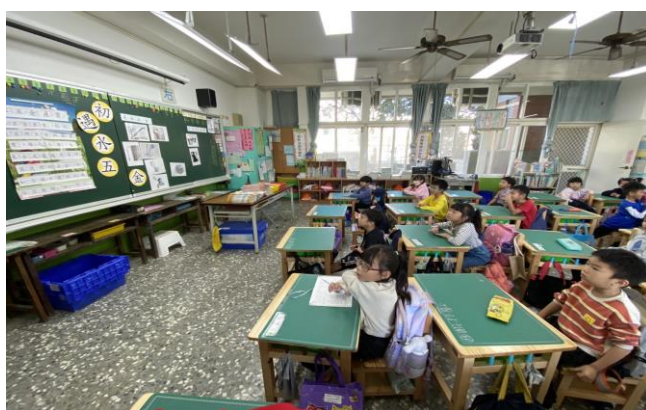
使用圖卡讓學生分辨水五金物品。