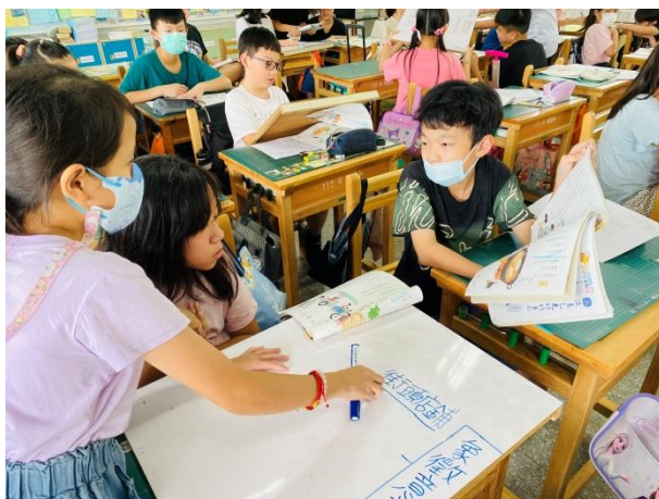
活動：教師複習心智圖、小組繪製各段心智圖