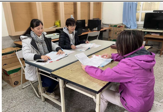
說明：授課教師自我省思與分享