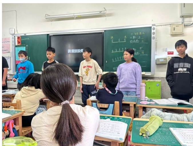
說明：學生排隊實作觀察