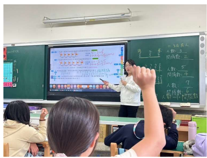
說明：師生一同歸納重點