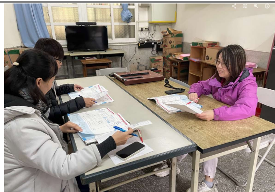
說明：授課教師自我省思與分享