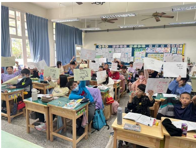
說明：演練各別加分