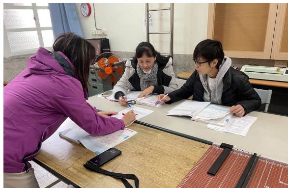
說明：觀課教師給予教學回饋