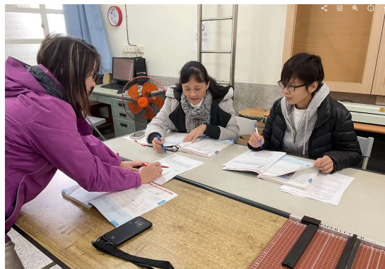
說明：觀課教師給予教學回饋