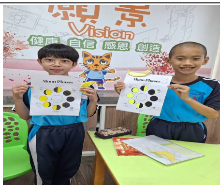
說明：學生快樂彩繪8大月相學習單