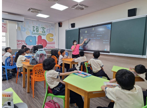
說明：說明8大月相英文說法