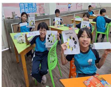
說明：學生快樂彩繪8大月相學習單