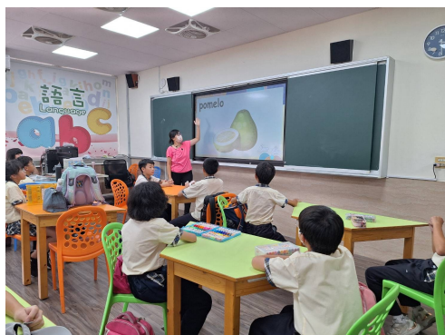
說明：複習節慶基本單字