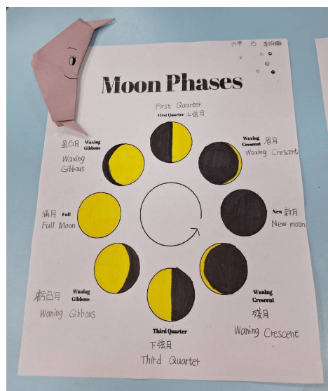
說明：學生完成回家作業 ——月亮摺紙