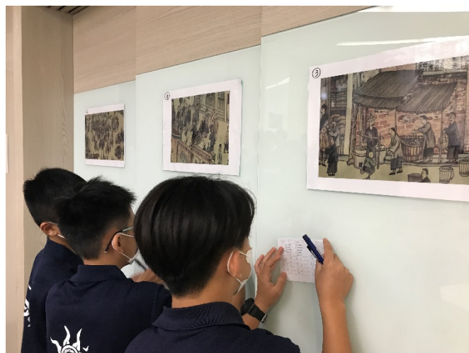
以鹿港印象引起學生興趣