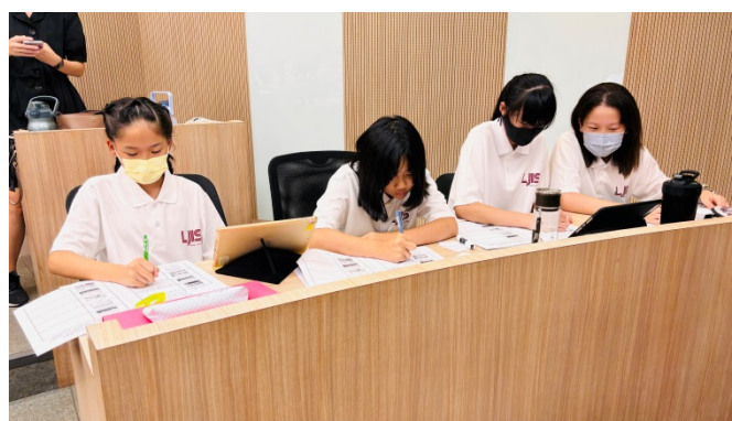
學生查詢資料統整鹿港歷史