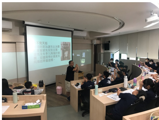
教師授課講述鹿港歷史變遷