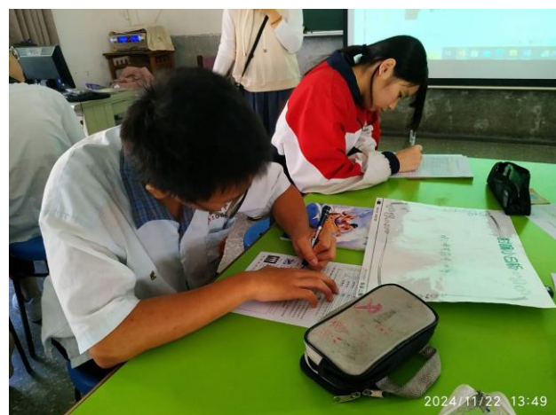
小組討論並填寫學習單