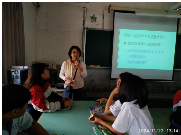
體驗遊戲:我的色卡顏色是什麼?