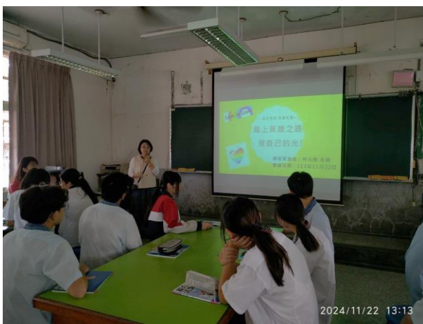
說明此次課程主題與學習目標