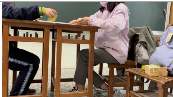
學生運用生涯卡選擇重要價值觀