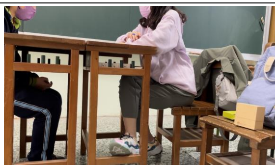
學生與老師分享自己減輕焦慮的方法