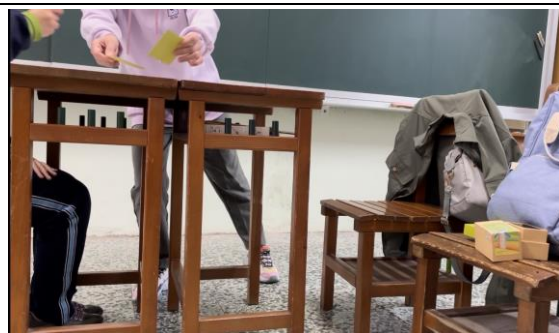
老師引導學生歸類各價值觀