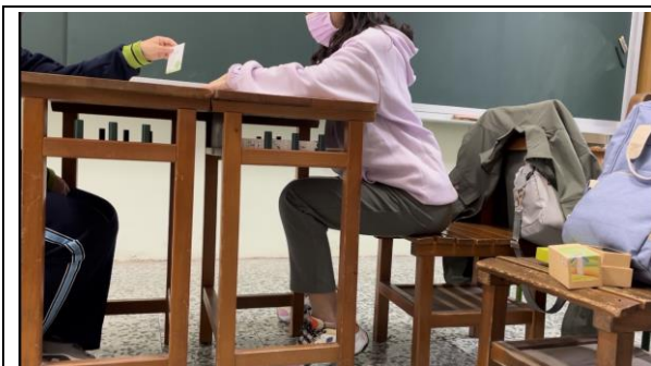
教師引導學生選出最重要的價值觀