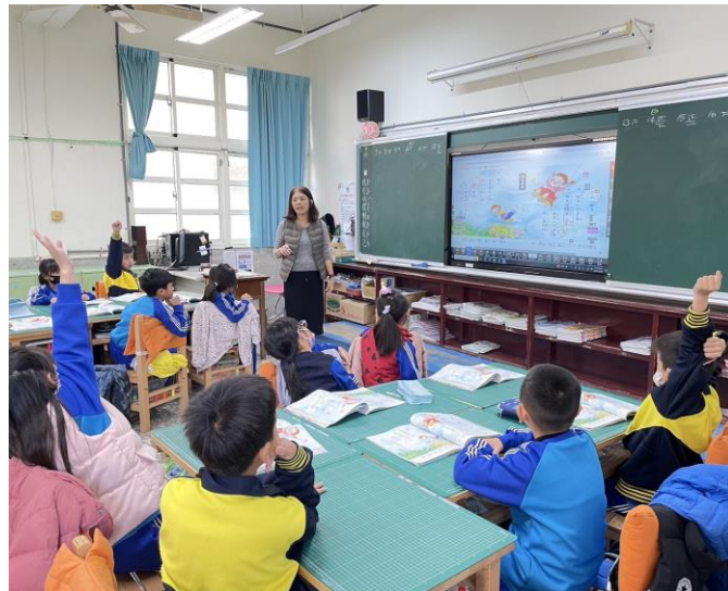
說明：分組討論發表