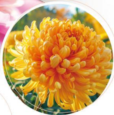
▲菊花 動畫 02:34